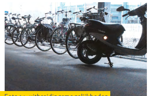
Foto 14: uitbreidingsmogelijkheden

3) Fietsparkeur is een set normen die de kwaliteit van een fietsenrek garandeert. Fietsenrekken die aan deze norm voldoen, zijn herkenbaar aan een sticker met het logo Fietsparkeur. Zie http://www.fietsersbond.nl/fietsparkeur