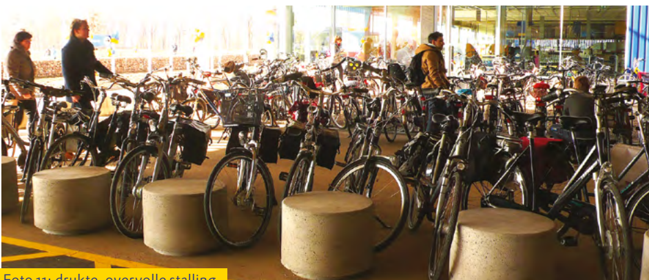
Foto 11: drukte, overvolle stalling