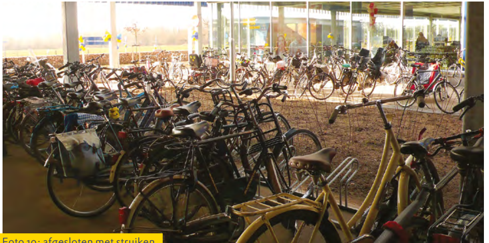
Foto 10: afgesloten met struiken